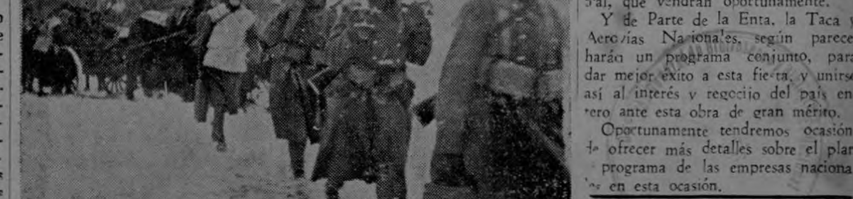
En el frente francés: un relevo en la nieve.

Para el día 19 de marzo próximo, en que se va a inaugurar el Aeropuerto Internacional de La Sabana, se han