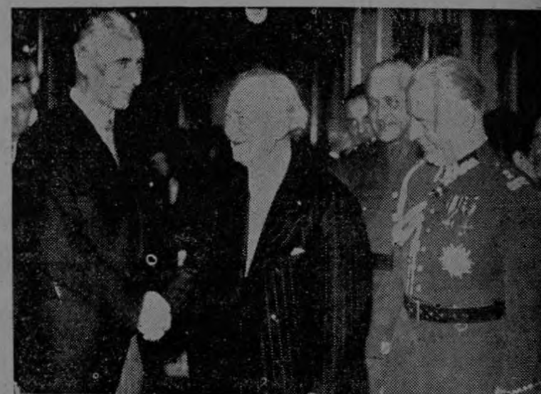
El Primer Consejo Nacional Polaco que se celebró en la Embajada de Polonia en París. — Paderewski, ex-presidente de la República polaca, estrechando la mano a Racziewicz, actual Presidente. A su derecha puede verse el general Sikorski.

En esta forma puede usted hacerse de un comfortable catre Solicite informes CICLO CLUB