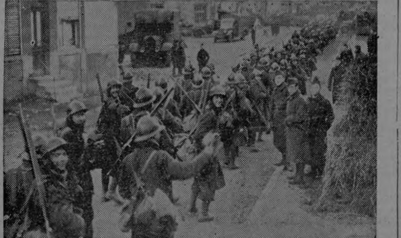
En la zona de guerra. — Tropas que regresan de la línea de fuego atraviesan una población.