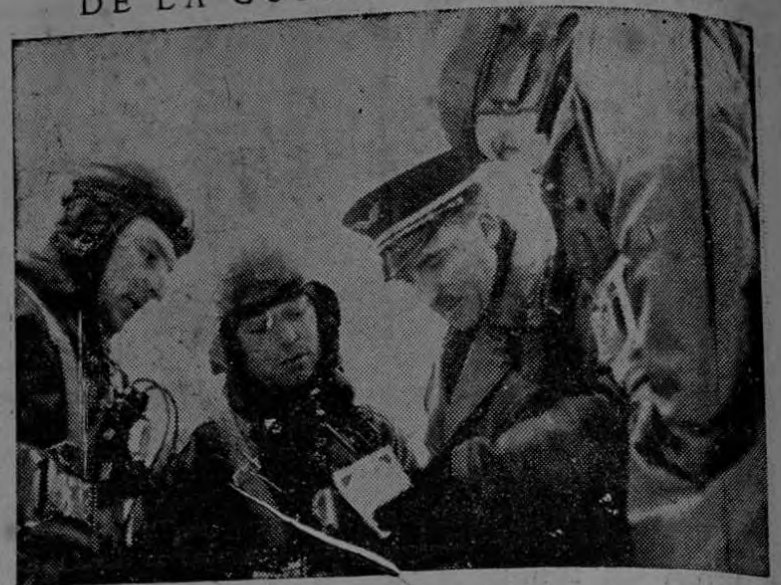
Un oficial intérprete traduce el texto de las hojas sueltas a la tripulación que va a partir a "difundirlas" en territorio enemigo.

nos alemanes." HELSINKI, 28. — Pocas noticias importantes llegan del frente. Los rumores de que los soviéticos se esfuerzan en llevar su ataque contra la ribera oeste de la bahía de Viipuri (Viborg) no son confirmados. En cuanto al empleo de trineos blindados de que la prensa sueca se hizo anoche eco, es posible que esto haya ocurrido pero los militares finlandeses no toman el hecho en serio: hasta ahora estas máquinas no han sido eficaces y menos lo han de ser contra posiciones bien definidas. COPENHAGUE, 28. — El correspondiente en Helsinki del Berlingske Efteravis informa que los rusos están acondicionando las minas de níquel de Salmijaervi con el auxilio de ingenieros alemanes.